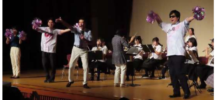
おおきに祭で吹奏楽部とマツケンサンバ

私ごとで恐縮です。8月18日までは元気そのものでした。その日は個人的な研究会の日で、朝から一日中、大阪で研究活動に勤しんでいました。研究会と言えばその後の懇親会が楽しみです。このときも旧知の仲間と楽しく語り合い、取組を交換し合いました。