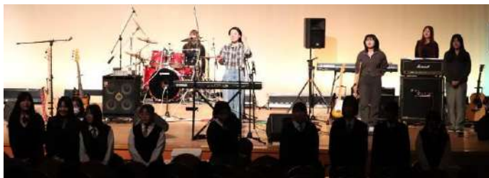
軽音楽部の卒部コンサート フィナーレのシーン

岩手県大船渡市の森林火災から約1か月が経ちました。その後、愛媛県や岡山県でも大規模な山火事が発生し、自宅から避難されるなど、現在も不自由な生活を余儀なくされておられる方が数多くおられます。