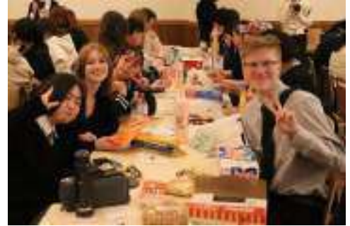
※カナダの高校生との交流会より

そのような中、四月になって以来毎日、全教職員は新年度の準備を進めています。初めて学級担任をする教員もいれば、まったく新しい仕事に携わることになる者もいて、教職員の方も“ドキドキ”と“ワクワク”の両方の気持ちをもって行動しているはずで