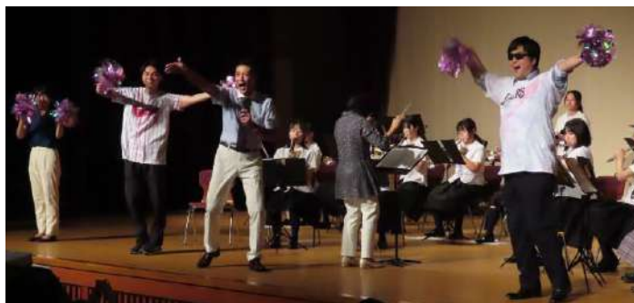
おおきに祭で吹奏楽部とマツケンサンバ

私ごとで恐縮です。8月18日までは元気そのものでした。その日は個人的な研究会の日で、朝から一日中、大阪で研究活動に勤しんでいました。研究会と言えばその後の懇親会が楽しみです。このときも旧知の仲間と楽しく語り合い、取組を交換し合いました。