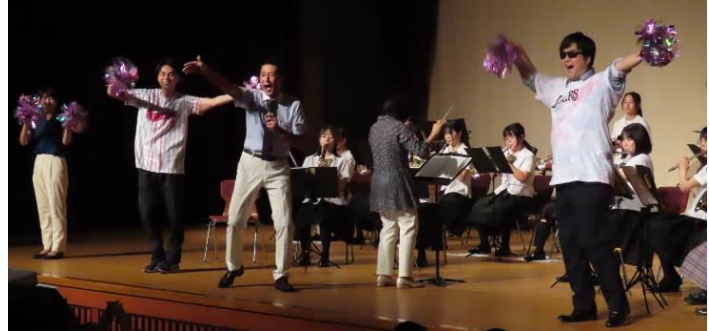
おおきに祭で吹奏楽部とマツケンサンバ

私ごとで恐縮です。8月18日までは元気そのものでした。その日は個人的な研究会の日で、朝から一日中、大阪で研究活動に勤しんでいました。研究会と言えばその後の懇親会が楽しみです。このときも旧知の仲間と楽しく語り合い、取組を交換し合いました。